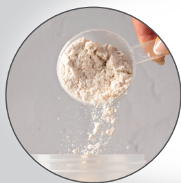
粉末、顆粒、錠剤、カプセル等