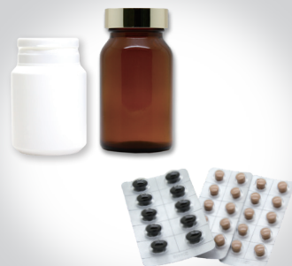
ボトル・ビン充填、PTP等