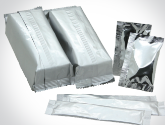
三包シール、スティック、 横ピロー 等